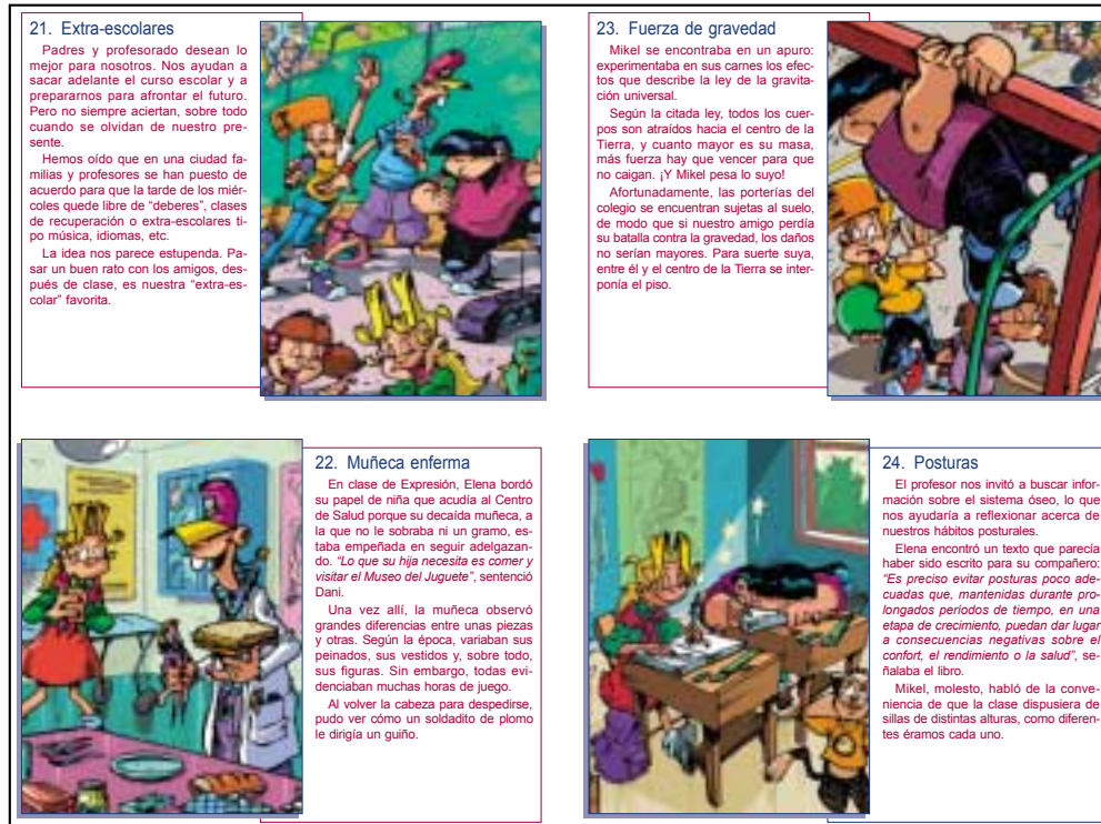
Página sobre hábitos saludables en el álbum de 6.º curso.

Sirva como ejemplo de lo dicho, las distintas aristas que en relación al tabaquismo recoge el programa a lo largo de los cursos 3.º, 4.º, 5.º y 6.º.